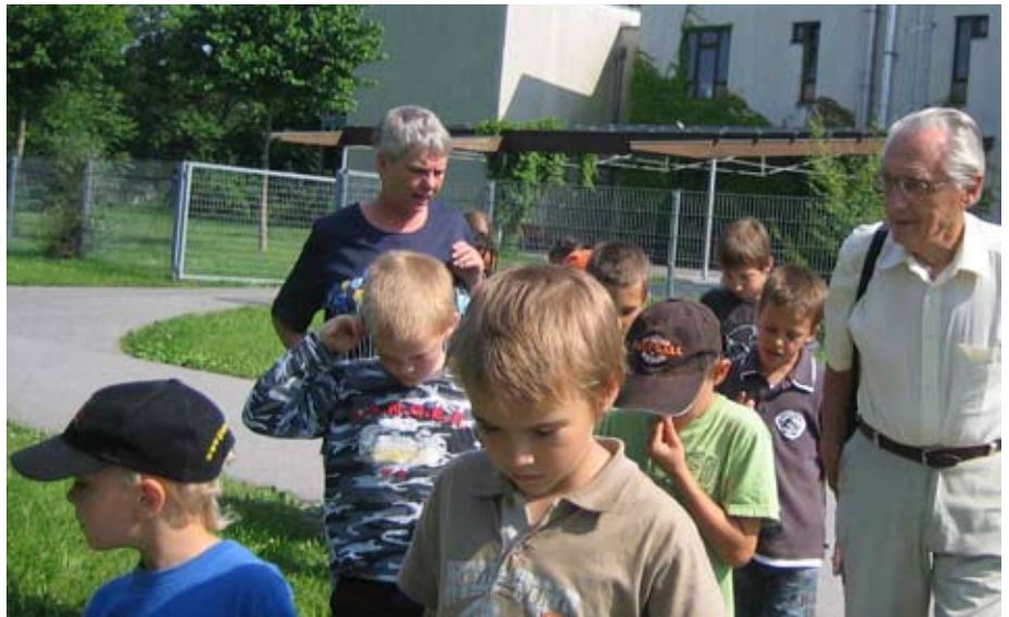
Hortkinder am Weg zur Bücherei im Kulturzentrum im Schloss Seyring

Nach dem ausgiebigen Essen war ein Verdauungsspaziergang angesagt. Die Route führte durch Seyring, dem Wald zum Skaterplatz und zurück zum Hort. Alle Kinder machten sich fertig für die