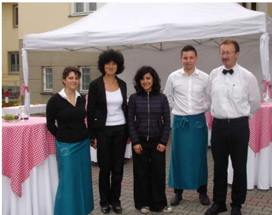
vor dem Rathaus in Gerasdorf