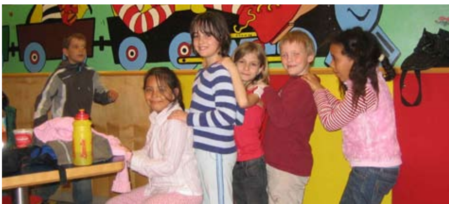
...es ist immer lustig im Hort Seyring

Das gemeinsame Frühstück schmeckte allen köstlich, danach wurde noch weiter gelesen und gespielt, bis die Kinder von ihren Eltern abgeholt wurden.