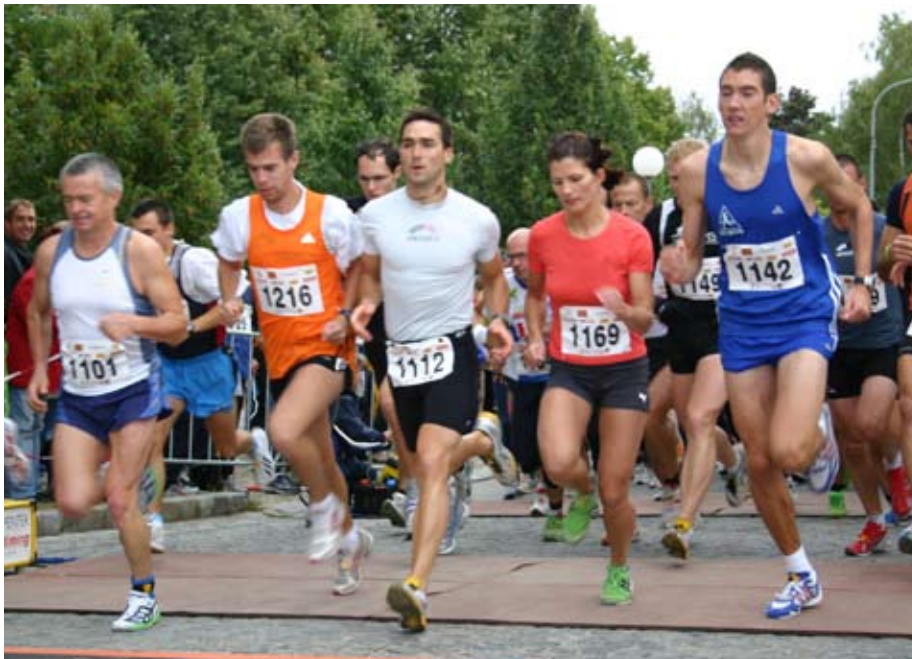
Wieder viele Teilnehmer beim 7. Gerasdorfer Stadtlauf 2008.

■ Trotz schlechtem Wetter fanden sich wieder 463 Läuferinnen und Läufer bei der Volksschule Oberlisse ein, um am 7. Gerasdorfer Stadtlauf teilzunehmen.