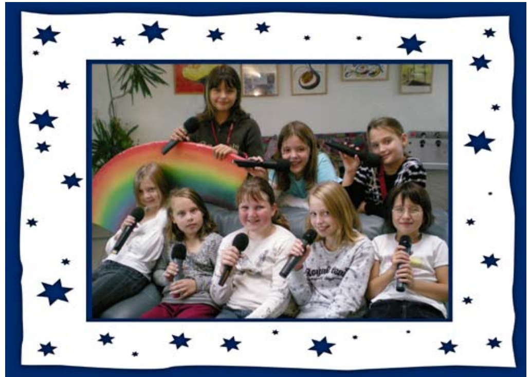
Die „neuen“ Regenbogenkinder im Schuljahr 2008/2009.

Am Samstag, 29. November, in der Hauptschule, Bahnstraße 26, im Rahmen des Gerasdorfer Adventmarktes.