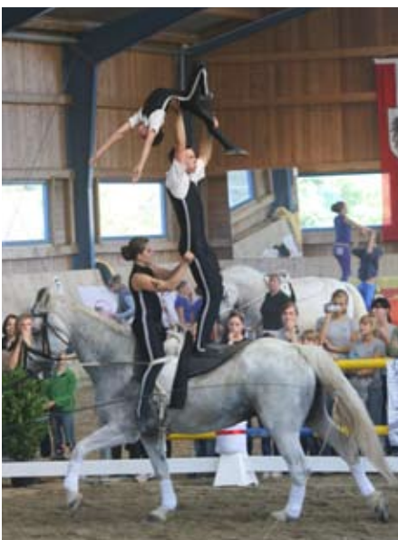
Akrobatic in höchster Vollendung