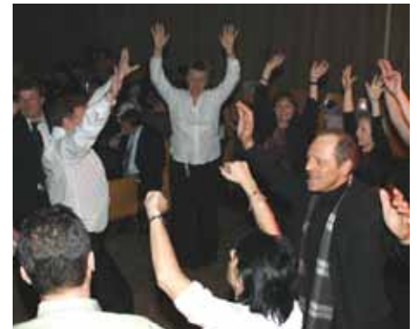
Ausgelassene Stimmung beim Sportlerball am 16. Jänner.