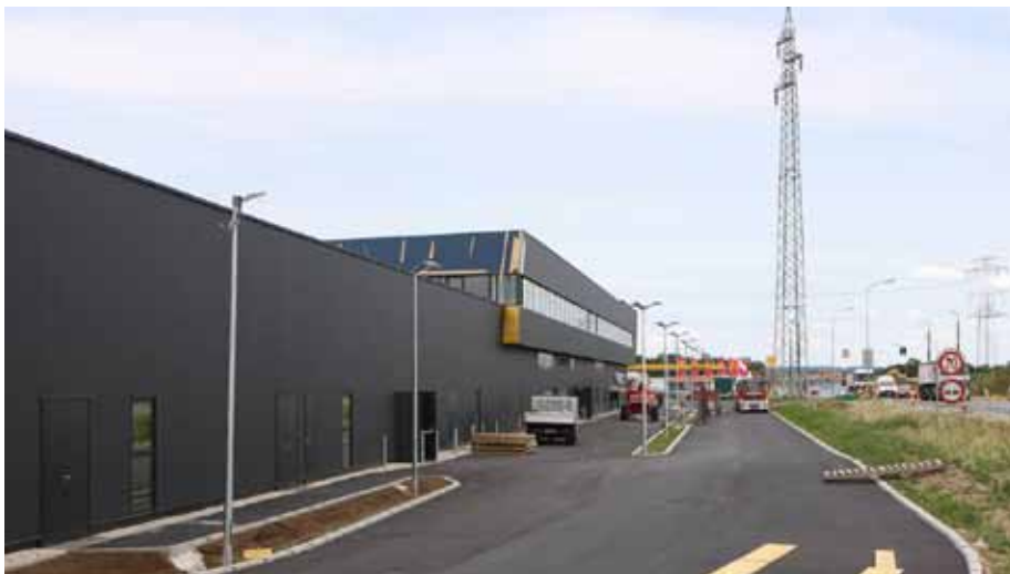
Die Aussenseite des Fachmarktcenters mit Zufahrtswegen.