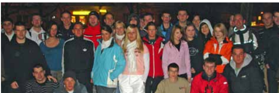
Die Gemeinde unterstützte wie jedes Jahr die Fahrt zum Schnee am 9.1.2010 zum Hirschenkogel und übernahm die Buskosten.