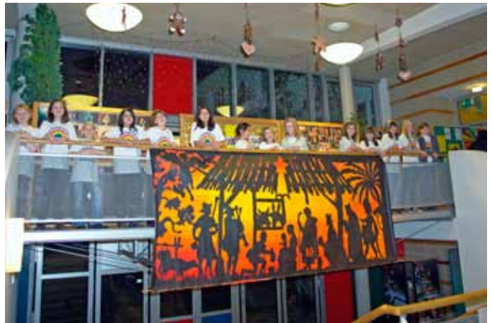
Das Konzert der Regenbogenkinder in der HS.