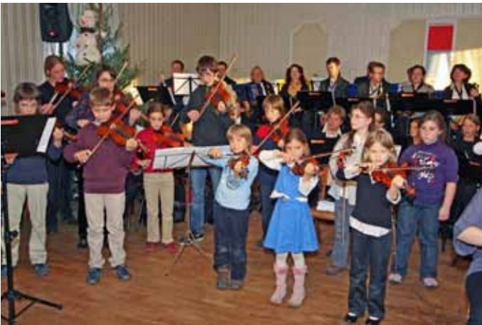
Die Geigenschüler der Musikschule Gerasdorf.