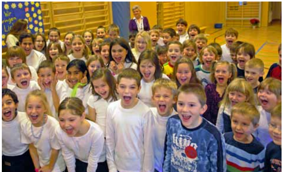
Große Freude bei den Kindern am Tag der Eröffnung.