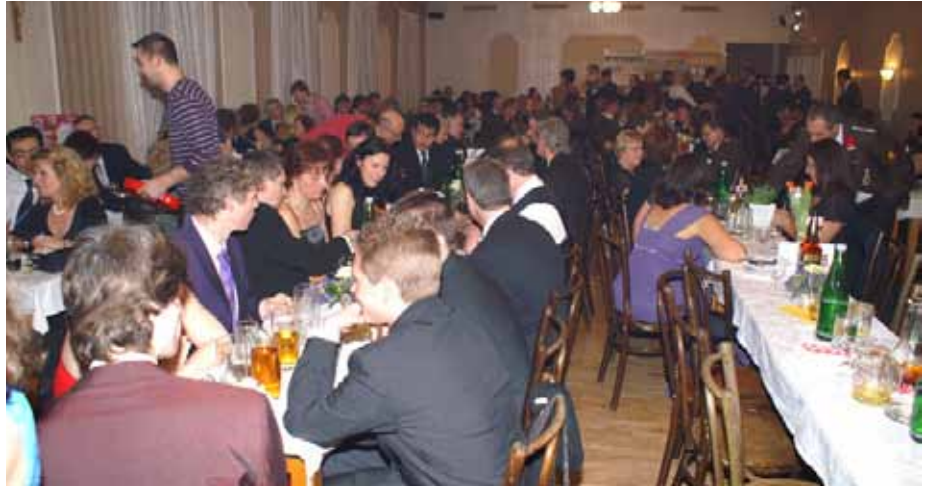
Auch heuer wieder gut besucht, der Ball der FF Gerasdorf.