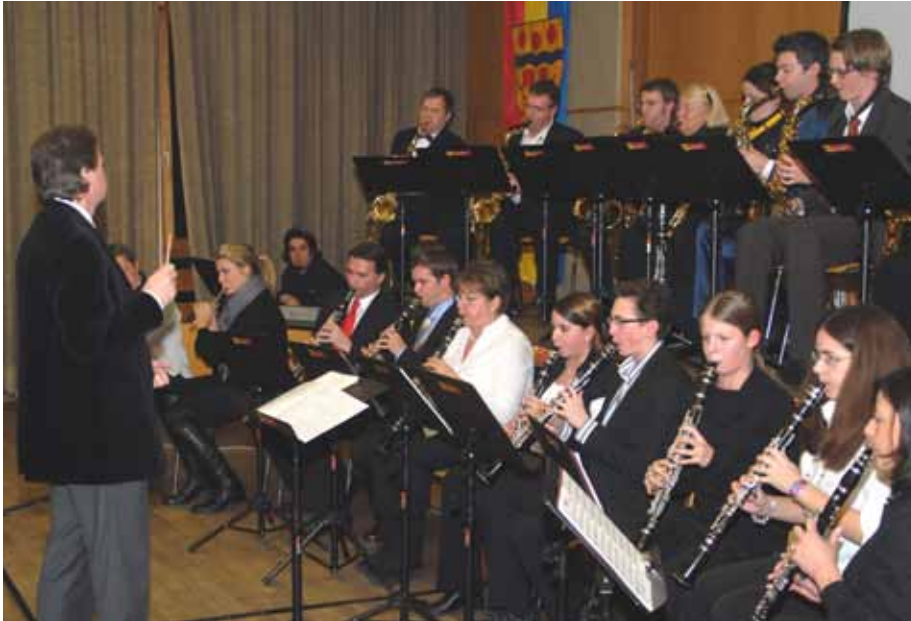
Die Eröffnung des Neubürgerempfanges durch die Musikschule.