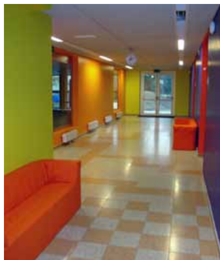
Innen ist es auch sehr bunt.