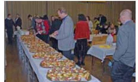
Das Buffet ist eröffnet.