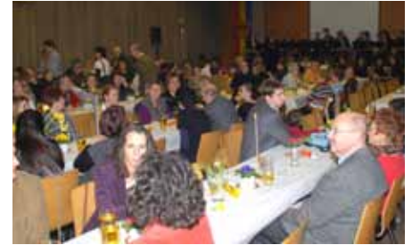
Im Jahr 2009 zugezogen.