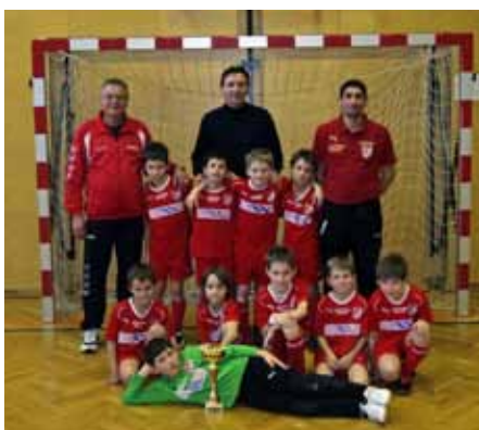
Das Hallenturnier in Seyring fand am 16., 23. u. 30.1. statt.