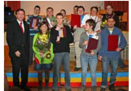
Die Medaillengewinner der Special Olympics 2010 in St. Pölten von „Geh mit uns“.