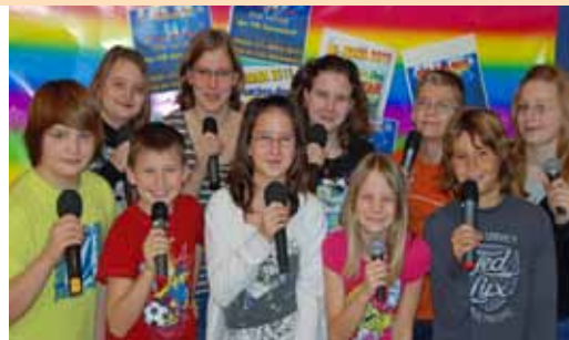
31.3. HS-Mania 2011