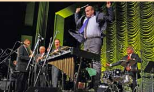
20.3. Three wise men