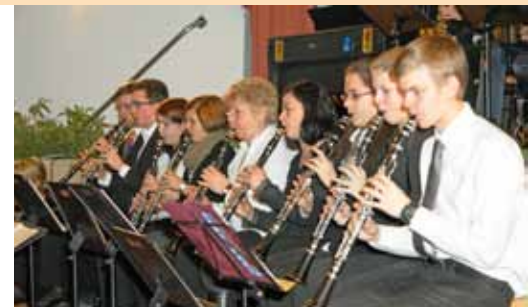
8.4. NÖ Musikschultag