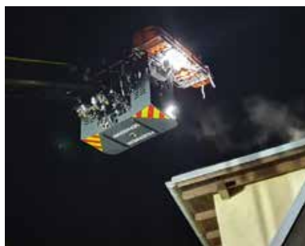
Rettung vom Dach

■ Am 16. Dezember 2020 wurde die FF Gerasdorf um 16:13 Uhr zu einem technischen Einsatz „Person in Notlage“ in der Brunnengasse alarmiert. Ein Mann ist vom Dach eines Einfamilienhauses auf ein Vordach gefallen. Das Rote Kreuz hat die Erstversorgung des Verunglückten vorgenommen.