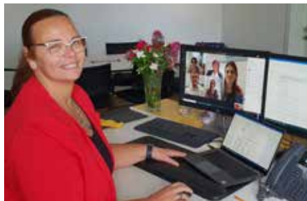
Virtuelle Besprechung: Stadtdirektorin Gerda Hirschhofer im Videoanruf

■ Wichtiger Digitalisierungsschritt: Für die Stadtgemeinde waren diese Ausgaben eine wichtige Investition in die Zukunft – in eine neue Arbeitsweise, die für alle Mitarbeiterinnen und Mitarbeiter mehr Freiraum und Flexibilität schafft. Die Möglichkeit zum Homeoffice wurde nicht nur im 2. und 3. Lockdown genutzt, sondern kam auch schon im Herbst für die Einteilung der Gemeindeverwaltung auf 2 Teams zur Corona-Prävention zum Einsatz.