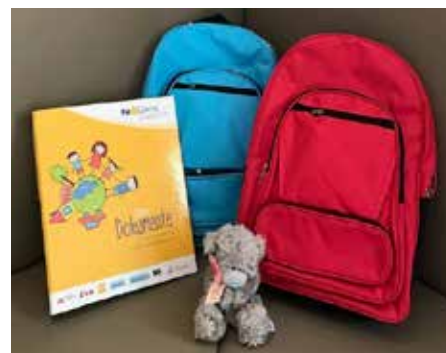
Wäschepaket für Neugeborene

■ Zur Abholung bringen Sie bitte die Geburtsurkunde Ihres Kindes mit. Im Bürgerservice des Rathauses ist das Wäschepaket in einem Rucksack erhältlich.