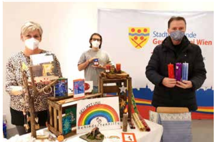
Verein "Geh mit uns - Behindertenhilfe"