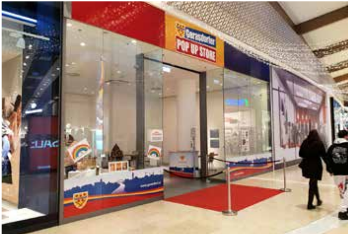
Gerasdorfer Pop Up Store im G3 Shopping Resort