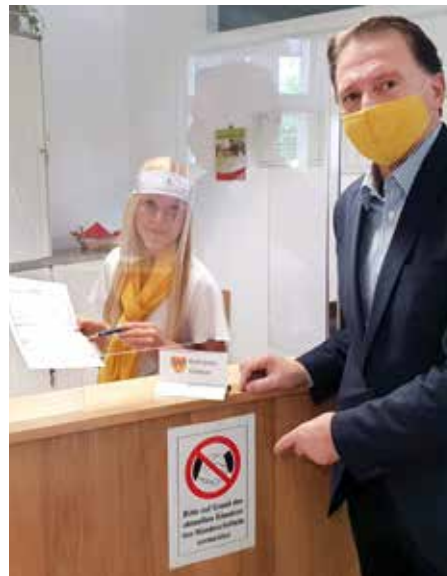
Corona-Sicherheitsmaßnahmen wie Schutzverglasungen wurden im Rathaus aufgestellt.

■ Um die Verbreitung der Pandemie einzudämmen und den Schutz der Gesundheit aller an erste Stelle zu setzen – also die Gesundheit der TeilnehmerInnen und Gäste, aber auch die des Publikums und der Arbeitskräfte, die den reibungslosen Ablauf der Events garantieren – wurden alle geplanten Veranstaltungen durch die Stadtgemeinde Gerasdorf bei Wien seit März 2020 abgesagt.