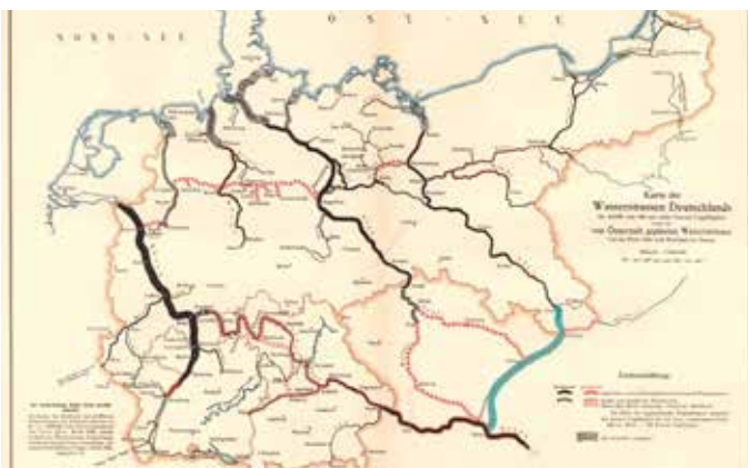
Abbildung 1: Karte der Wasserwege in Deutschland und Österreich 1903 1