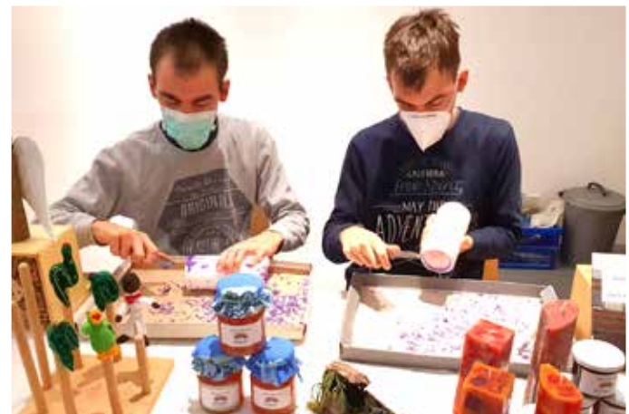
"Geh mit uns": Anvertraute schälen gespendete Kerzenreste