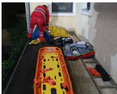
Vorbereitungen der Rettung