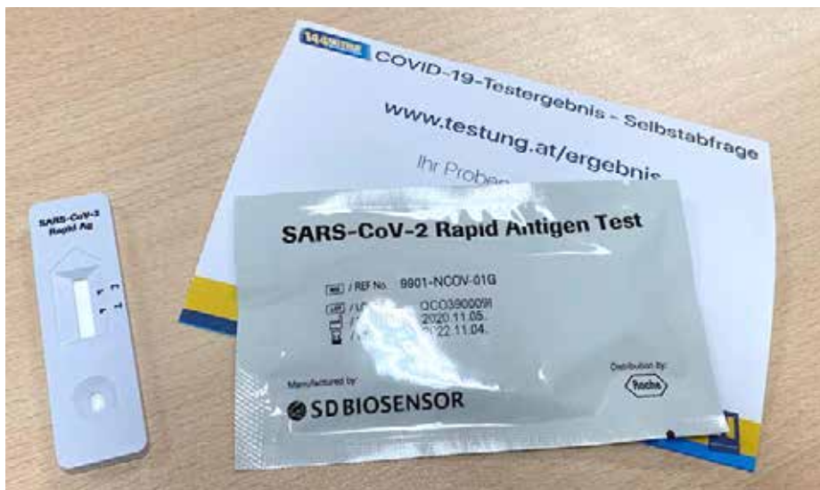
Antigen-Tests der NÖ-Massentestung im Dezember und Jänner.

■ Massentestungen tragen dazu bei, jene Menschen, die (noch) keine Symptome einer Erkrankung zeigen, aber trotzdem COVID-19-positiv sind, zu finden, noch bevor sich ein neuer Ansteckungscluster bilden kann.