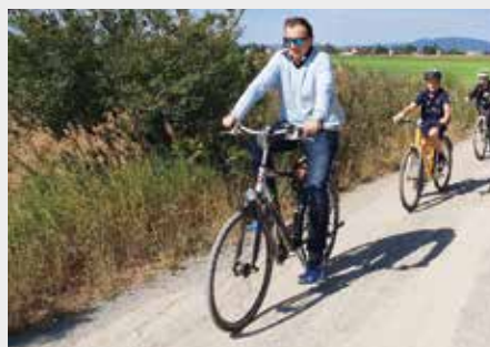
Das Radwege-Netz wird stetig erweitert.

Mit dem Radweg in der Westlichen Scheunenstraße erfolgt der Lücken-