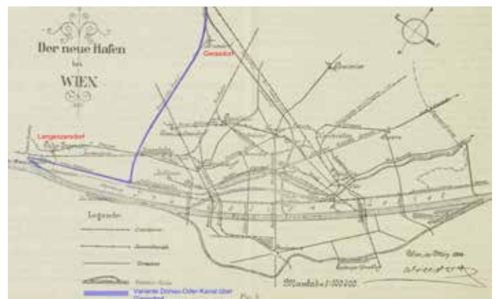
Abbildung 2: Der neue Hafen bei Wien 1904 2