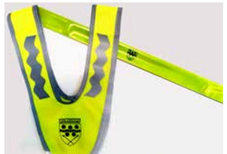
Signalband & Signalkragen