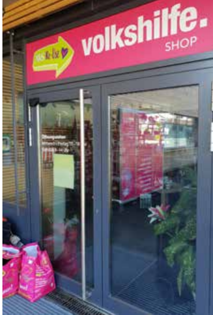
ReUse Shop in Schwadorf

Montag 10 bis 15 Uhr Dienstag bis Freitag 10 bis 18 Uhr