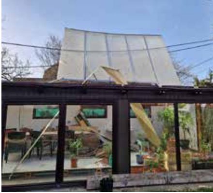
Blechdach in einer Stromleitung

■ Am 26. März war die FF Gerasdorf im Gemeindegebiet zur Beseitigung der Sturmschäden unterwegs.