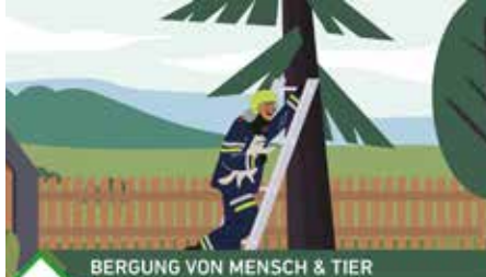
BERGUNG VON MENSCH & TIER

Verunfallte Fahrzeuge werden aus dem Gefahrenbereich geschleppt, um den Verkehrsfluss wiederherzustellen.