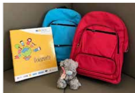
Wäschepaket der Gemeinde für Neugeborene