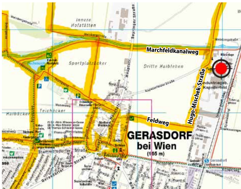
Sicher über Radwege (gelb markiert) zum Familien-Stadtfest: Entlang vom Marchfeldkanalweg sowie über den Feldweg von der Östlichen Scheunenstraße zur Hugo-Mischek-Straße gelangen Sie mit dem Rad oder zu Fuß zum Wirtschaftshofgelände in der Fabriksgasse.

■ Verkehrskonzept für das Familien-Stadtfest 2024 am Wirtschaftshofgelände (Fabriksgasse 5a, 2201 Gerasdorf bei Wien):