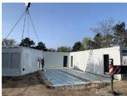
Das Provisorium wird in Leichtbauweise modular mit tels Containern errichtet.

■ Das Provisorium wird in modularer Bauweise mit Containern auf dem Areal des Spielplatzes gegenüber vom Gemeindezentrum Föhrenhain realisiert. Ein Neubau erfolgt später.