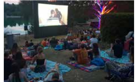
Sommerkino am Badeteich

■ Mehr Infos folgen in der Juni-Ausgabe.