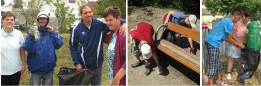
Die Anvertrauten des Vereins "Geh mit uns - Behindertenhilfe" halten unsere Spielplätze sauber

■ Ein herzliches Danke an "Geh mit uns – Behindertenhilfe" für den langjährigen Einsatz: Seit 29 Jahren unterstützt der Verein "Geh mit uns" die Stadtgemeinde dabei, unsere Spielplätze sauber zu halten.