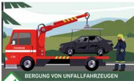
BERGUNG VON UNFALLFAHRZEUGEN

Mit viel Knowhow und Fachwissen bekämpfen unsere Feuerwehren Brände unterschiedlichster Art.